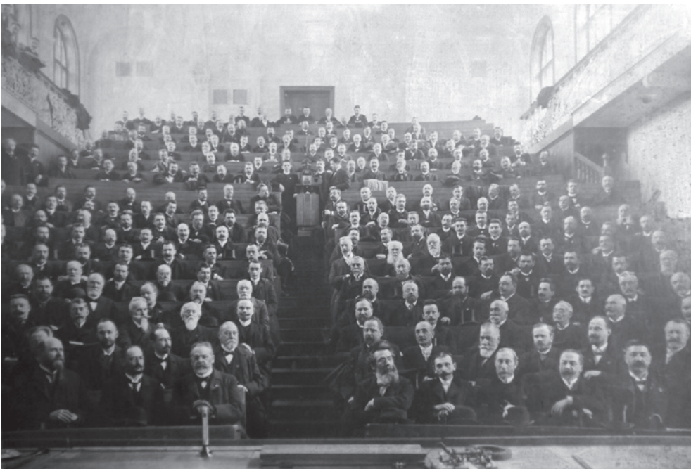
Versammlung des Österreichischen Ingenieur- und Architektenvereins 1904.

Gesellschaften wie der Österreichische Ingenieur- und Architektenverein, der Niederösterreichische Gewerbeverein oder die k. k. Landwirtschafts-Gesellschaft in Wien unterhielten wissenschaftliche Vortrags- und Zeitschriftenreihen, führten Forschungsaufträge und Ausstellungen durch, wirkten an der (inter)nationalen Standardisierung von Technologien mit und initiierten die Gründung von Museen und staatlichen Lehr- und Versuchsanstalten. Als wissenschaftlich-wirtschaftliche Vereinigungen nutzten sie politische, wirtschaftliche und kommunikative Ressourcen und führten kooperative Unternehmungen durch. Sie förderten den Austausch von Wissen und Technik zwischen verschiedenen gesellschaftlichen Gruppen und prägten damit den Wirtschafts- und Wissenschaftsstandort Wien wesentlich mit. Das Forschungsprojekt untersucht diese langfristigen Prozesse und vergleicht sie mit Entwicklungen in anderen europäischen Ländern.